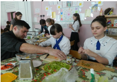
Конкурс «Кулинарный поединок»

- активизация позиции семьи в образовании детей, в приобщении