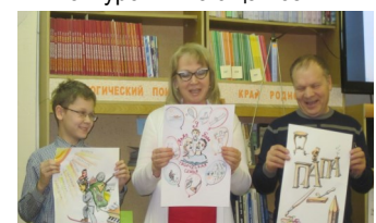
Конкурс «Читающая семья»

Школа делегирует родителям полномочия в сфере общественного управления. Успешно функционирует Управляющий совет школы, призванный решать вопросы развития школы, прокладывая курс школьного корабля на несколько лет вперед. На протяжении 5 лет в школе родители участвуют в работе благотворительного фонда «Альянс», работа которого