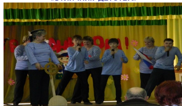
Смотр-конкурс родительских комитетов «ОТЛИЧНИК ДЕТСТВА»

готовить выступления ребят, конкурс «Поющая семья», «Читающая семья», которые сплачивают детей и родителей, внося вклад в духовно-нравственное воспитание подрастающего поколения, конкурсные программы «Дочки-матери» и «Варвара – краса, длинная коса», где мамы с дочками могут раскрыть свои таланты и способности. В рамках Дня открытых дверей в школе проходит Фестиваль семейного творчества «Талантливы вместе». Родители совместно с детьми участвуют в различных номинациях таких, как «Вокальное искусство», «Художественное слово», «Декоративно-прикладное творчество», «Изобразительное искусство». Интересно проходят заседания общешкольного родительского комитета, на которых в течение года предсе-