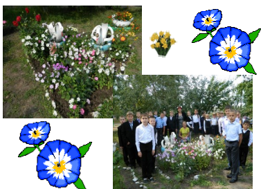
Проект «Летний сад - школе»

коллектив, передать опыт игрового общения, домашнего чтения, опыт поддержки ребенка в новой для него учебной деятельности. В подростковом возрасте - периоде развития коллективизма, отзывчивости, милосердия продуктивны проводимые в школе дни здоровья, различные благотворительные акции «Помоги ученику нашей школы», «Дети – детям» по сбору канцелярии, памперсов, одежды для детей из детских домов, участие в благотворительных концертах в Доме престарелых, в Клубе ветеранов, в перинатальном центре, а также в